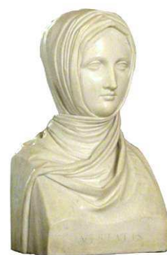
A. Canova, Vestale