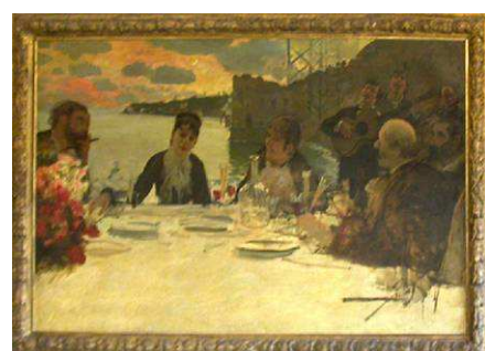
G. De Nittis, Pranzo a Posillipo