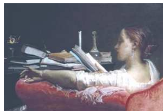
F. Faruffini, La lettrice